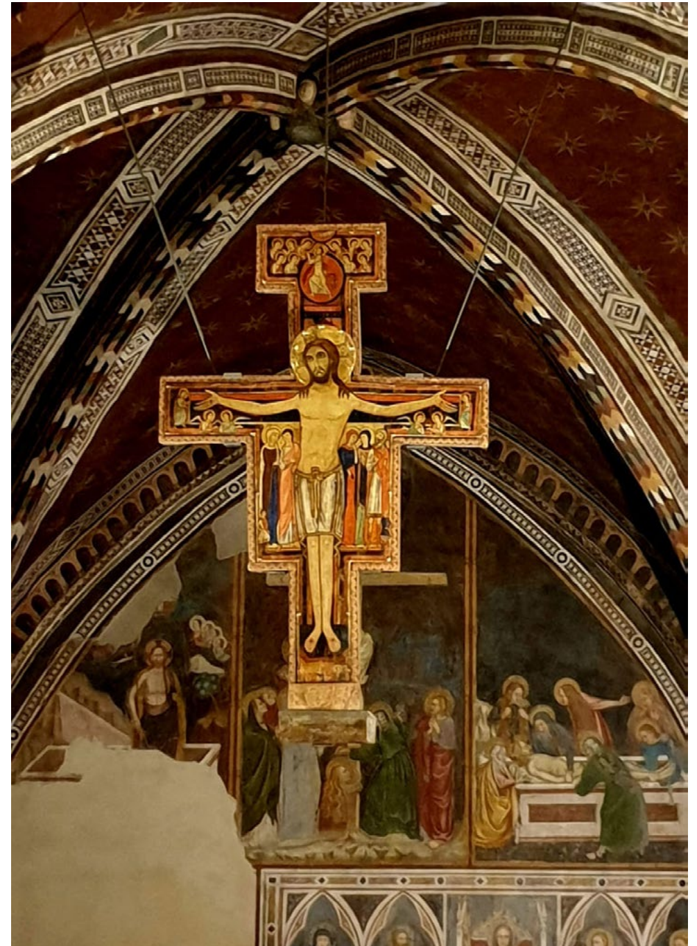
© Text & Bild: Andreas Wilke, Pfarrer

PS: Wie gesagt, das Kreuz gibt Kraft und Erleuchtung dazu!