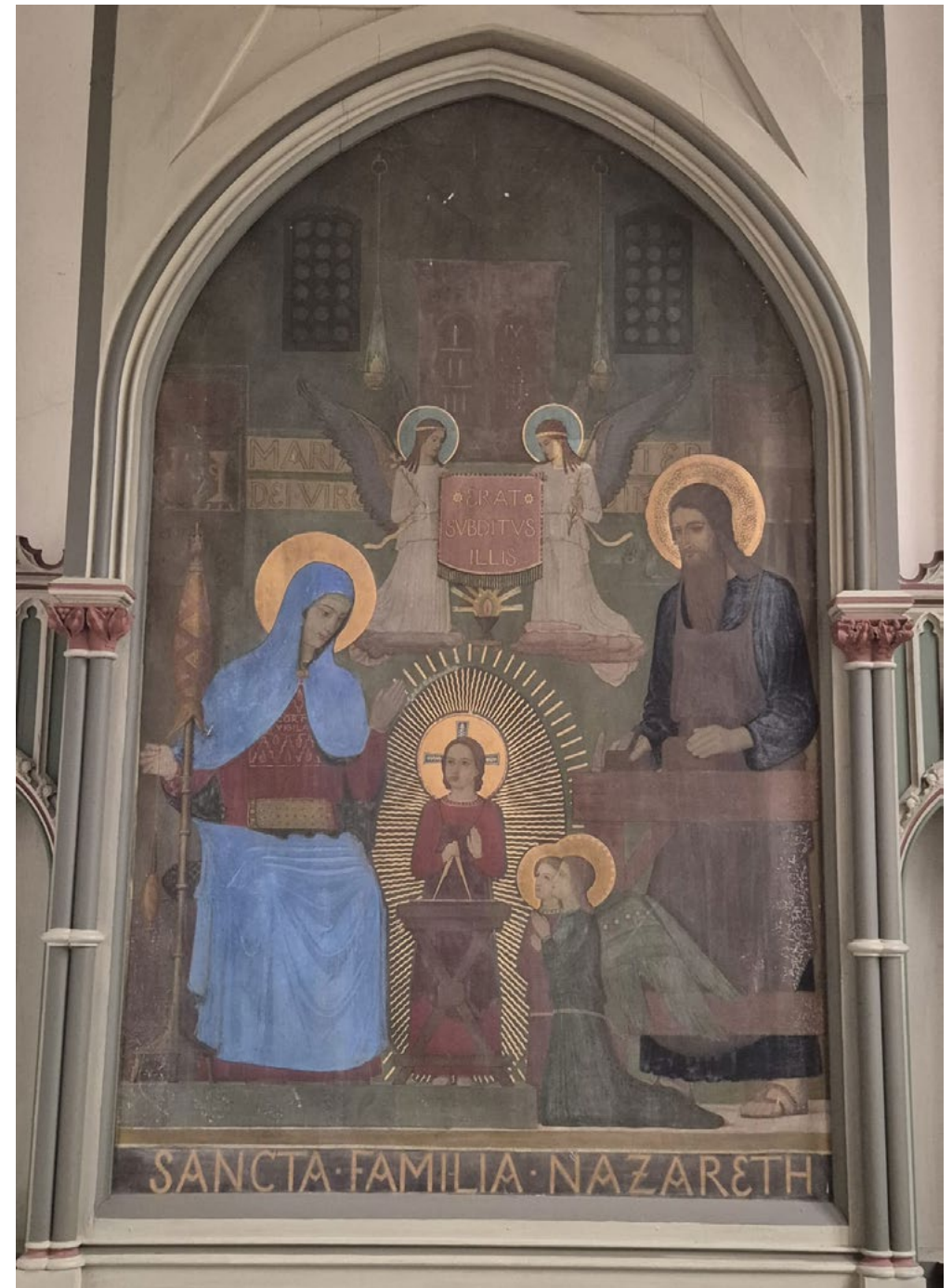
© Text & Bild: Andreas Wilke, Pfarrer